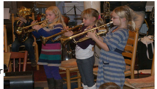
Optreden na schoolproject Wieger wordt Wakker

Omdat het aantal leerlingen groeit is deze commissie onlangs gevormd. De commissie zal zich uitsluitend bezig houden met de jeugd en zal activiteiten voor en met de leerlingen en hun ouders organiseren. Verderop in deze nieuwsbrief zullen wij ons aan u voorstellen.