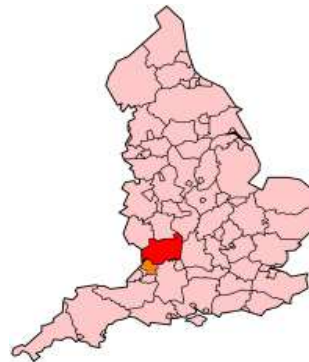
De provincie Gloucestershire

Op de website van Apollo kun je de foto's van deze reis bekijken!