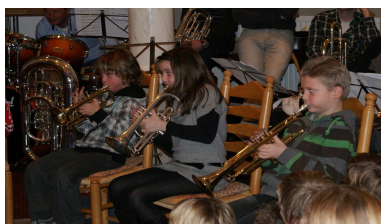
Slotconcert leerling project Twa Fiskien December 2010

Vanaf 10 juni 2011 zal er net als in het november op de basisschool de Twa Fiskien een leerlingproject worden gehouden op de christelijke basisschool Nijdjip. Op deze wijze willen we graag nog